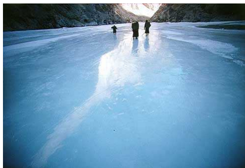
Le Zanskar gelé Suggestion d'itinéraire

Au cœur du Ladakh, la vallée du Zanskar est coupée du monde sept à huit mois par an. De novembre à mai, l'accès à cette région, entourée de hautes montagnes, est bloqué par les neiges qui recouvrent les routes des cols. Les quelques 14 000 habitants de la région, la plupart bouddhistes d'origine tibétaine, vivent alors en totale autarcie. Seule brèche à l'isolement de ces villages : la rivière gelée du Zanskar.