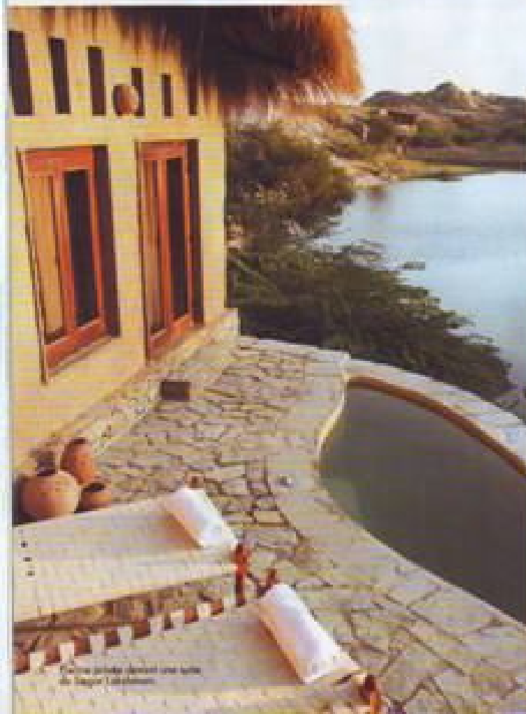
Le pool est un lieu idéal pour se relaxer et profiter de la vue sur le lac et les montagnes.