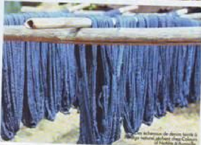
Les filets de pêcheur de la plage de l'établissement Duta.