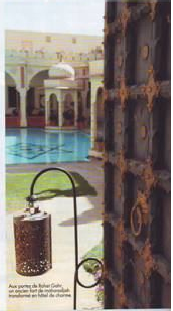
Aux côtés de Bahari, un ancien fort de marocain est transformé en hôtel de charme.