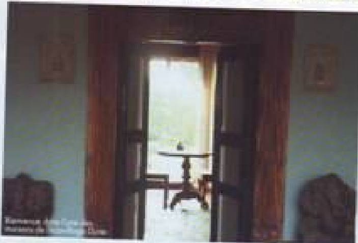
Le coucher de soleil vu depuis l'établissement Duta.