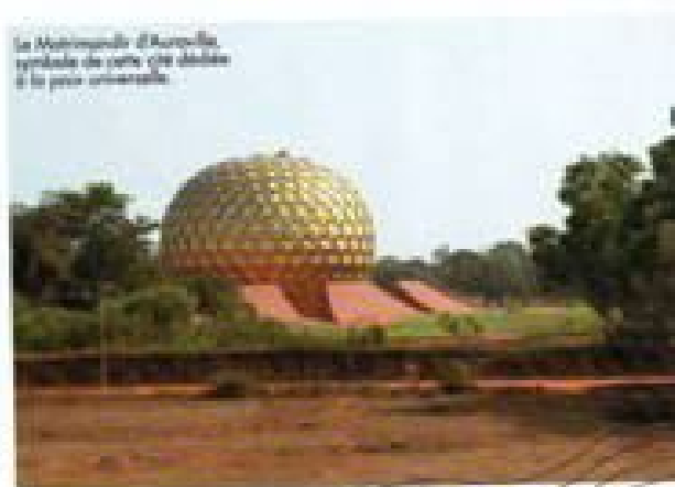
Le Maitre-marché d'Auroville , symbole de cette cité dédiée à la paix universelle.