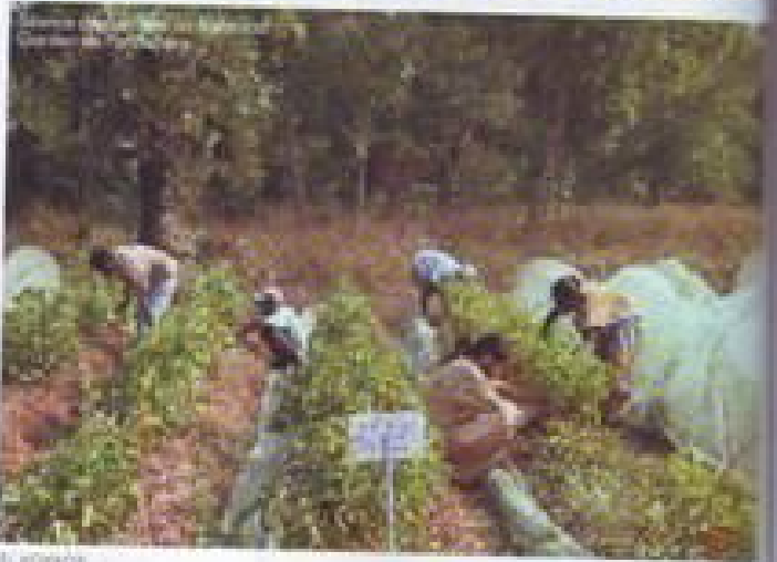
Des travailleurs agricoles à la ferme de l'établissement Duta.