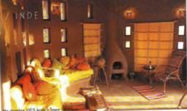
Ma chambre 100% arabe à Sagar

Grâce à Joss, je réalise que la nature reprend vite ses droits si on lui en donne l'occasion. Je trace ensuite au Sud, vers Pondichéry, une ville où cohabitent un quartier français et un quartier indien. La route cahotique et dangereuse m'a étonné, et une halte au Energie Home s'impose. Que du cru ! Ici, on n'achète ni n'avale rien au hasard. Toutes les vertus énergétiques et médicinales des aliments sont exploitées. Cette petite cantine indienne vous induit la pêche en moins de deux. Lorsque vous mangez des aliments crus, vous conservez 90 % de leur énergie, alors que quand vous les cuisinez vous en perdez 60 %. Un petit smoothie à base de 33 herbes et arachides accompagnés de quelques mets végétariens seront l'équation idéale de mon "rebondage". La preuve. Allez hop ! En rickshaw (le taxi-tricycle) pour une visite de la ville. Évidemment, j'opte pour la version à pédale histoire de moins empoisonner les piétons. Dans