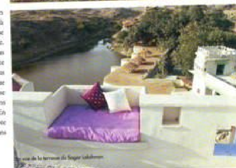
Vue de la réserve de Sagar Lakshman