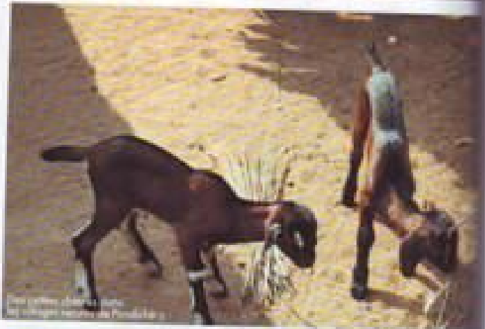
Des chèvres et des moutons à la plage de l'établissement Duta.