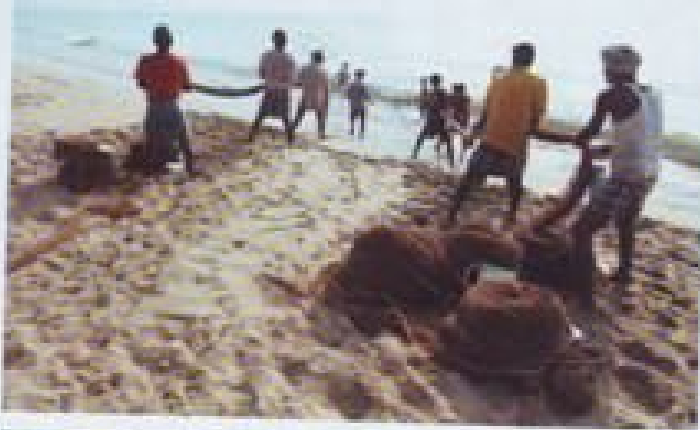
Des pêcheurs relèvent leurs filets sur la plage de l'établissement Duta.