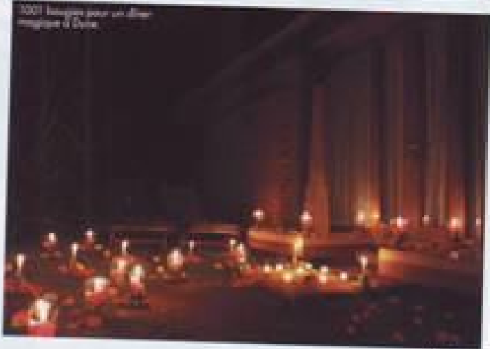
2001 bougies pour un dîner romantique à Duta.