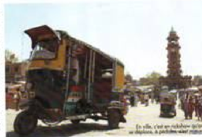
En ville, c'est un véritable défilé de dévotion. À l'arrière-plan, le temple de la déesse.