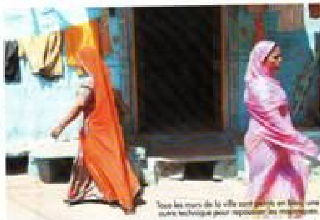
Tous les murs de la ville sont peints en blanc, une autre technique pour repousser les moustiques.