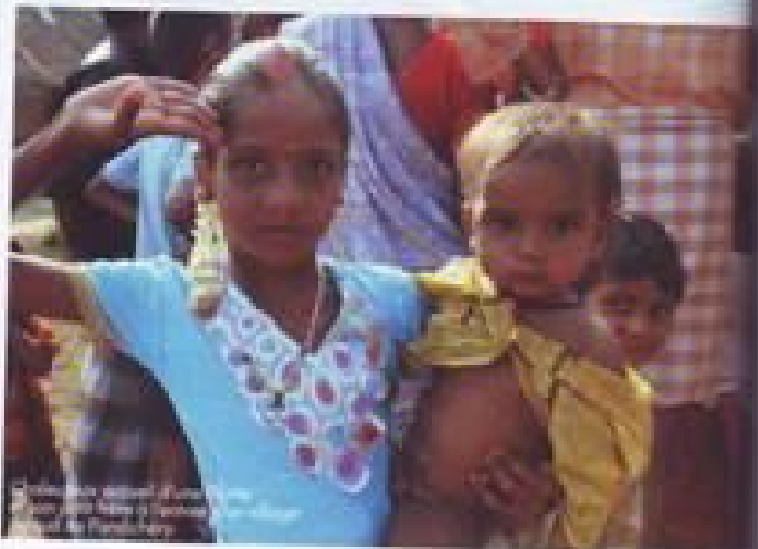
Une jeune fille et son bébé à la plage de l'établissement Duta.